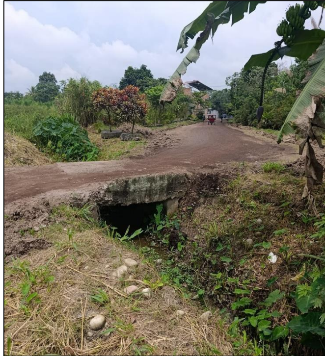
Figura N° 04: Alcantarilla y cuerpo de agua superficial en el área de ampliación