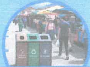
Mantén el espacio público limpio