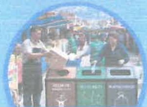
Acopia correctamente los residuos sólidos