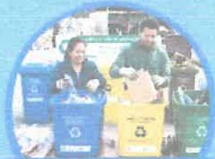
Clasifica y separa los residuos sólidos

Chilca REGISTRADA MUNICIPAL EDUCCA ÁREA DE TURISMO Y FERIAS