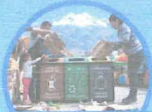
Utiliza adecuadamente los contenedores de residuos sólidos