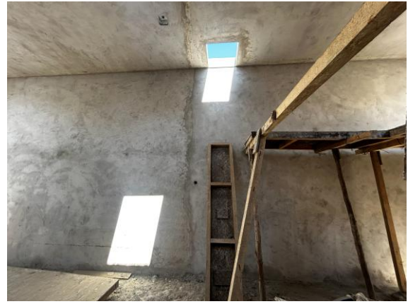
Ubicación propuesta de medidores de caudal al interior de la cámara