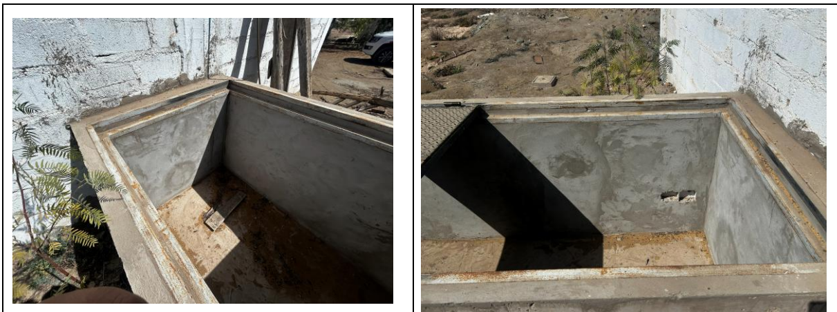
Ubicación propuesta de medidores de caudal al interior de la cámara

Se instalará el tablero eléctrico en una caseta. En relación con los planos eléctricos proporcionados, se muestra la posible ubicación del tablero.