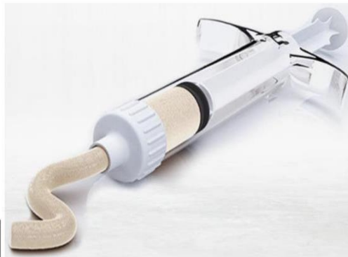
Fig. 1: (Set de sustituto óseo sintético, no incluye diseño)