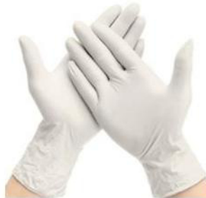
Fig.1: Guante para examen descartable de látex sin polvo (no incluye diseño)