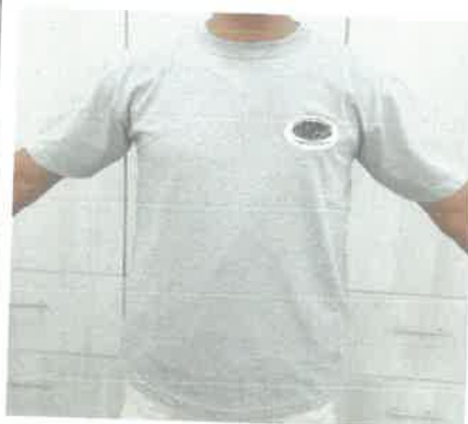
CAMISETA CON CUELLO PIQUE