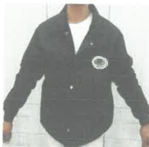
LOGOTIPO DE LA FACULTAD DE ZOOTECNIA