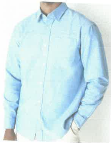
CAMISA SIN LOGOTIPO

INCLUYE IMAGEN REFERENCIAL (DE CORRESPONDER)