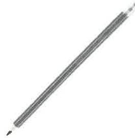
6. PAPEL BOND 75 g TAMAÑO A4