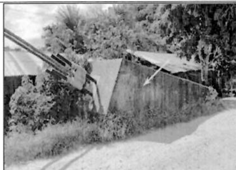
Imagen N°03. Visualización de vegetación en zona de anclaje.