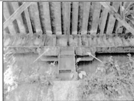
Imagen N°04. Visualización de vegetación en zona de apoyo (Asiento de puente).