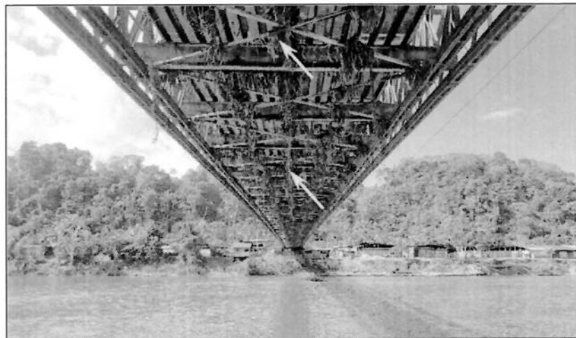
Imagen N°02. Visualización panorámica de vegetación debajo del puente.