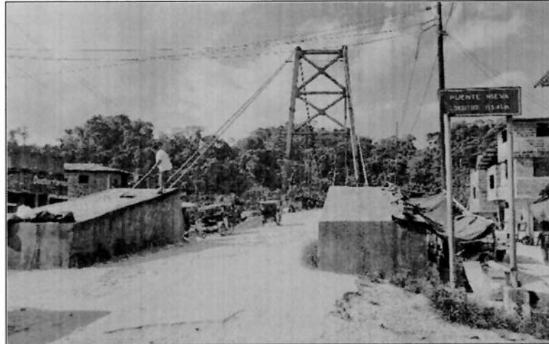
Imagen N°02. Visualización panorámica del puente colgante.

materiales diversos, insectos, roedores, murciélagos o aves. Asimismo, se busca que estén libres de letreros o avisos distintos a la señalización de la vía.