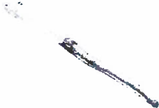
Fig. 1. Cepillo dental para adulto