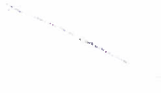
Fig.2. Cepillo dental para niño.