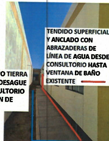
TENDIDO SUPERFICIAL Y ANCLADO CON ABRAZADERAS DE LÍNEA DE AGUA DESDE CONSULTORIO HASTA VENTANA DE BAÑO EXISTENTE