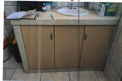
LAVATORIO EMPOTRADO EN MUEBLE DE GRANITO