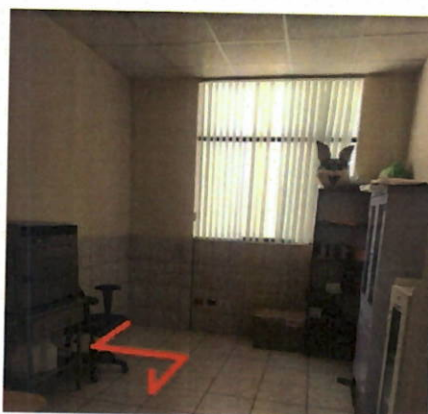
TRAZADO SUGERIDO PARA TUBERÍAS DE AGUA Y DESAGUE