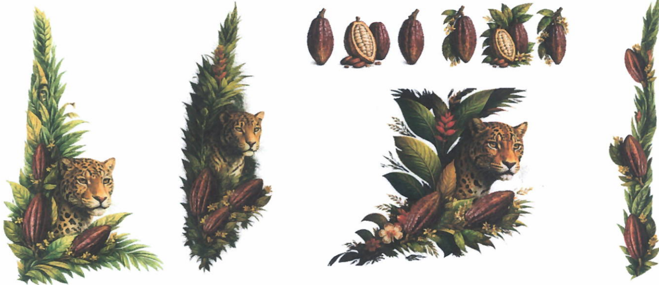
Estampado representativo de Expo amazónica