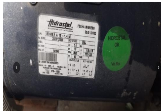
Imágenes 01 y 02: electrobomba de impulsión existente

Nota: con el objeto de cumplir con la finalidad pública del servicio y con la calidad necesaria, el postor deberá adjuntar a su propuesta técnica-económica, las fichas y especificaciones técnicas de los materiales e insumos a emplear, incluyendo información comercial, como marca, modelo, tipo, etc., así como características físicas y mecánicas, norma técnica, etc; a fin de ser evaluados y validados por el área usuaria. Las fichas y especificaciones técnicas deben señalar al material con precisión, es decir no deber ser genéricas.