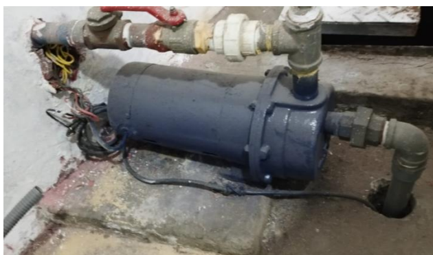
Imágenes 09 y 10: electrobomba de impulsión existente

Nota: con el objeto de cumplir con la finalidad pública del servicio y con la calidad necesaria, el postor deberá adjuntar a su propuesta técnica-económica, las fichas y especificaciones técnicas de los materiales e insumos a emplear, incluyendo información comercial, como marca, modelo, tipo, etc., así como características físicas y mecánicas, norma técnica, etc; a fin de ser evaluados y validados por el área usuaria.