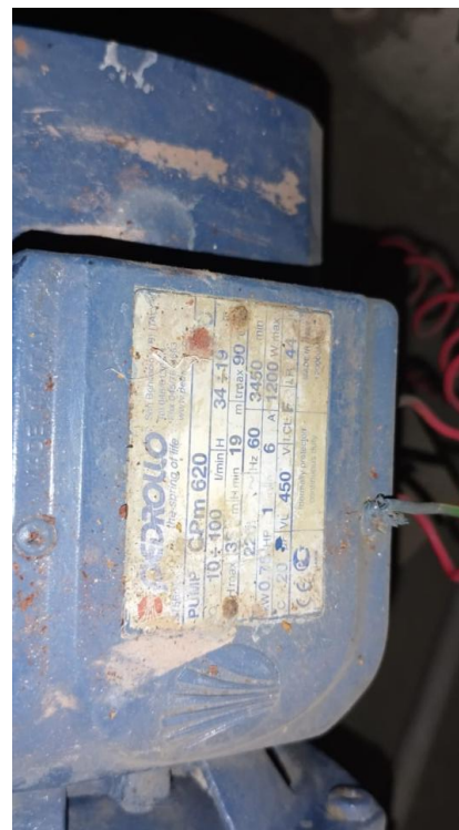
Imágenes 14 y 15: electrobomba de impulsión existente

Nota: con el objeto de cumplir con la finalidad pública del servicio y con la calidad necesaria, el postor deberá adjuntar a su propuesta técnica-económica, las fichas y especificaciones técnicas de los materiales e insumos a emplear, incluyendo información comercial, como marca, modelo, tipo, etc., así como características físicas y mecánicas, norma técnica, etc; a fin de ser evaluados y validados por el área usuaria.