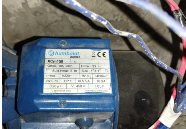
Imágenes 07 y 08: electrobomba de impulsión existente

Nota: con el objeto de cumplir con la finalidad pública del servicio y con la calidad necesaria, el postor deberá adjuntar a su propuesta técnica-económica, las fichas y especificaciones técnicas de los materiales e insumos a emplear, incluyendo información comercial, como marca, modelo, tipo, etc., así como características físicas y mecánicas, norma técnica, etc; a fin de ser evaluados y validados por el área usuaria. Las fichas y especificaciones técnicas deben señalar al material con precisión, es decir no deber ser genéricas.