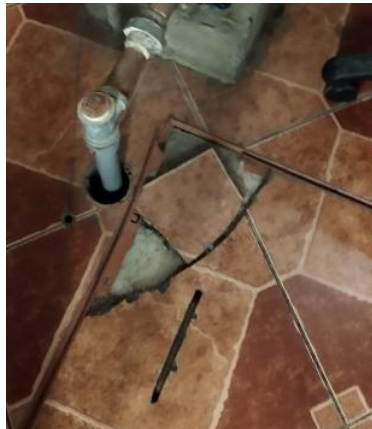
Imagen 06: estado actual de la tapa del tanque cisterna

Esta partida comprende el suministro e instalación de piezas cerámicas de alto tránsito y antideslizante de 45x45cm incluye fragua (color igual y/o similar al existente), crucetas, pegamento en polvo blanco extrafuerte. Se debe comprobar que las zonas donde se instalara el nuevo piso cerámico estén limpias y libre de imperfecciones. Para el diseño cerámico debe tomarse como referencia el cerámico instalado en el ambiente o similar. Además, se empleará señalizaciones en caso la situación lo requiera, con la finalidad de informar a los empleados de la sede central para que no transiten por el área de la instalación y dañen el nuevo piso cerámico. Al finalizar la instalación, se debe tener una acabado uniforme y libre de zonas huecas.