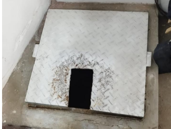
Imagen 11: tapa metálica existente del tanque cisterna

Nota: con el objeto de cumplir con la finalidad pública del servicio y con la calidad necesaria, el postor deberá adjuntar a su propuesta técnica-económica, las fichas y especificaciones técnicas de los materiales e insumos a emplear, incluyendo información comercial, como marca, modelo, tipo, etc., así como características físicas y mecánicas, norma técnica, etc; a fin de ser evaluados y validados por el área usuaria.