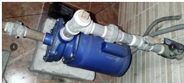
Imágenes 03, 04 y 05: electrobomba de impulsión existente

Nota: con el objeto de cumplir con la finalidad pública del servicio y con la calidad necesaria, el postor deberá adjuntar a su propuesta técnica-económica, las fichas y