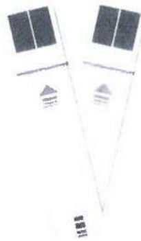
Fig.1: Tira Reactiva para determinar Glucosa en Sangre (no incluye diseño)