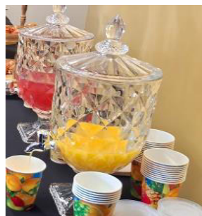
Imagen 1. Imagen referencial de dispensador de bebidas