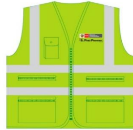
técnicas frente Foto N° 2