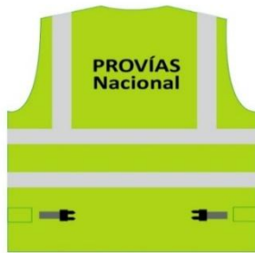
Características Foto N° 1 de (frontal). detrás