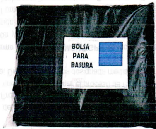
IMAGEN REFERENCIAL: BOLSAS PLASTICAS DE 77CM X 90CM

Justo E Neces E. Servantes Eduardo INGENIERO CIVIL N° Reg. CIP: 325565