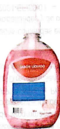
Imagen Referencial: JABÓN LIQUIDO X 1L