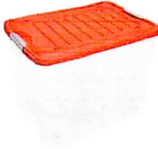
Imagen Referencial: CAJA ORGANIZADORA DE PLÁSTICO X 20L

Caja organizadora de plástico incorporado con asa. Diseñado con una medida de 33 x 34 x 39 cm de medida, capacidad de 20 litros y resistente material de PVC; asimismo, sus variados colores lo hacen adaptable a distintos ambientes en los que se encuentre.