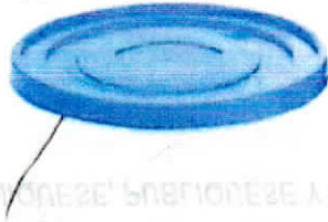
Imagen Referencial BALDE PORTABLE CON CAÑO X 20L