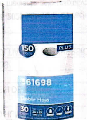
IMAGEN REFERENCIAL: PAPEL TOALLA 20CM X 22CM