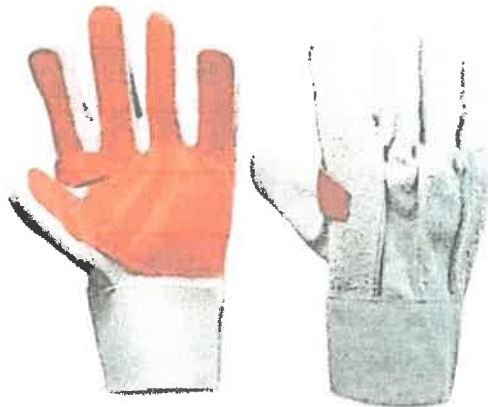
Imagen Referencial Del GUANTES DE CUERO REFORZADO

Nece Nece E. Servantes Eduardo INGENIERO CIVIL N° Reg. CIP: 325565