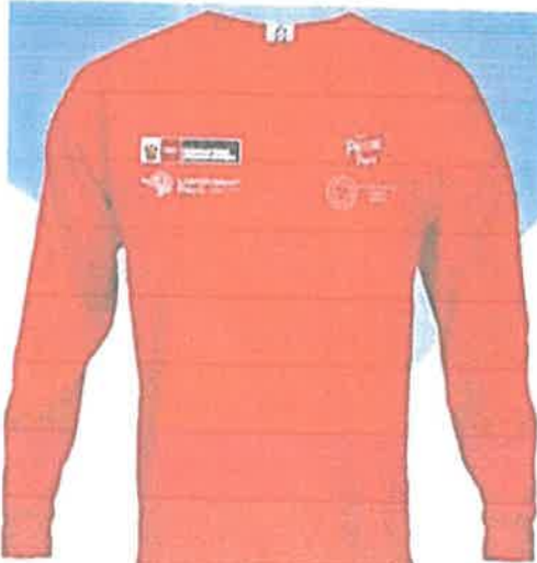
Polos estampado parte frontal

Budkiz Neces E. Servantes Eduardo INGENIERO CIVIL N° Reg. CIP: 325565