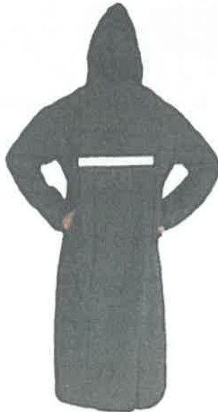
Imagen Referencial botas de jebes punta de acero

'Año de la recuperación y consolidación de la economía peruana'