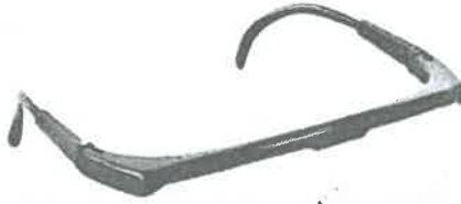
Imagen Referencial Lentes de Seguridad