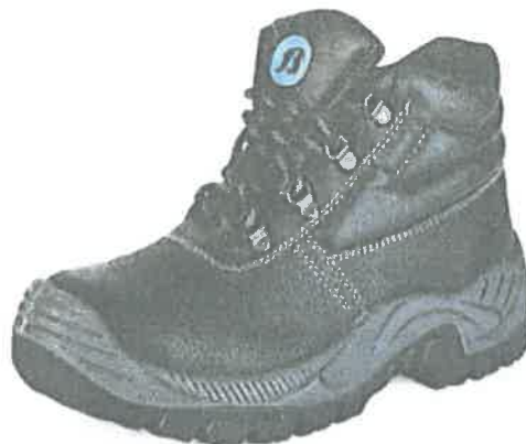
Imagen Referencial zapato de Seguridad plantel técnico