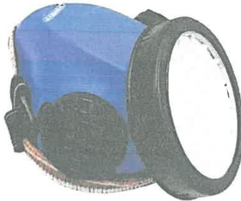
Imagen Referencial Respirador para polvo Reusable no tóxico