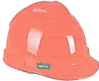
Imagen Referencial del Caso de Seguridad COLOR ROJO