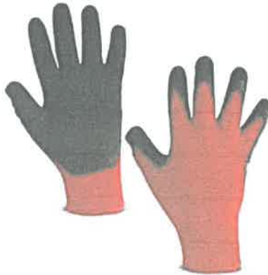
Imagen Referencial De/ GUANTES DE HILO CON PALMA DE LÁTEX