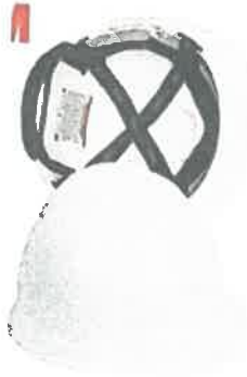
Imagen Referencial Del Caso de Seguridad PERSONAL TECNICO

'Año de la recuperación y consolidación de la economía peruana'