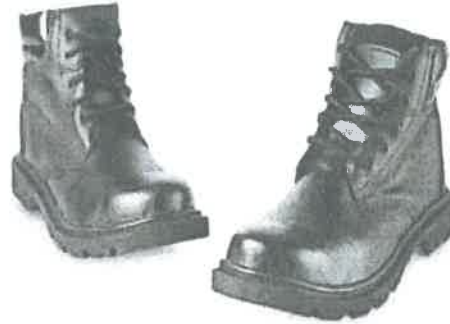
Imagen Referencial zapato de Seguridad

"Año de la recuperación y consolidación de la economía peruana"