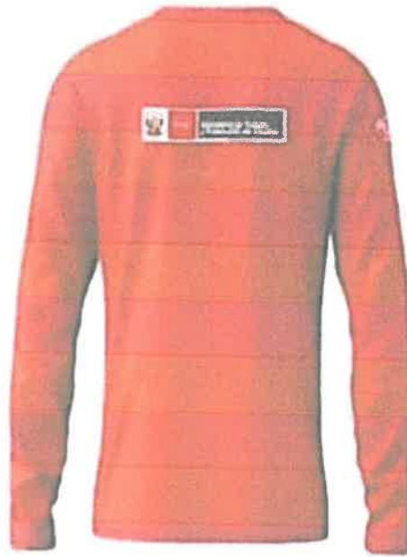
Polos estampado parte posterior

"Año de la recuperación y consolidación de la economía peruana"