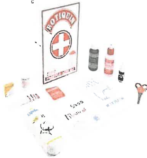
Imagen Referencial Del BOTIQUIN