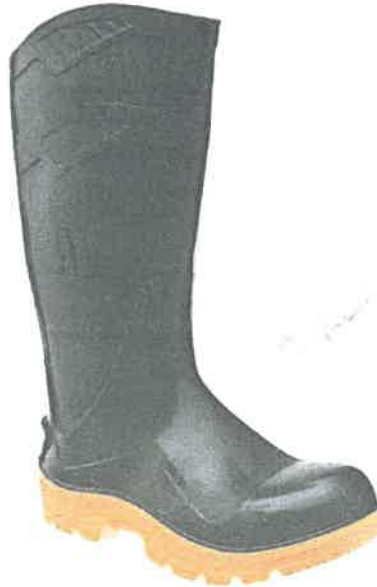
Imagen Referencial botas de jebe punta de acero