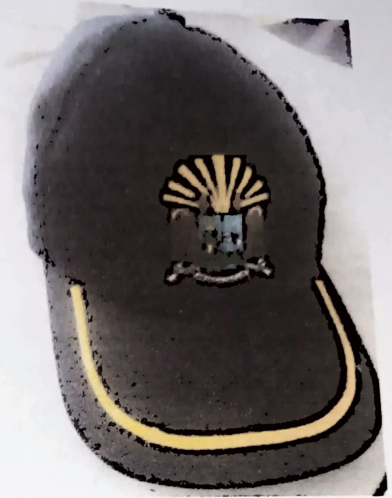
GORRA DRILL COLOR AZUL NOCHE