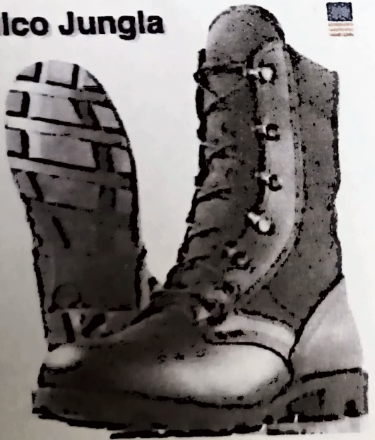
BORCEGUÍES COLOR NEGRO