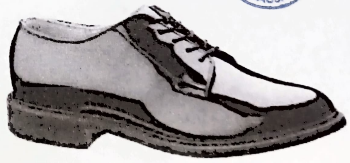
ZAPATO CHAROL CORFAN COLOR NEGRO