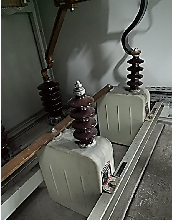
Imagen de condensador preexistente

Nota: La altura del aislador es de 280mm