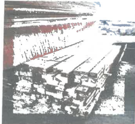
Imagen Referencial: TABLAS DE MADERA Y LISTONES DE TORNILLO