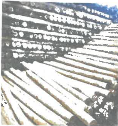
Imagen Referencial: MADERA EUCALIPTO ROLLIZO

"Año de la recuperación y consolidación de la economía peruana"