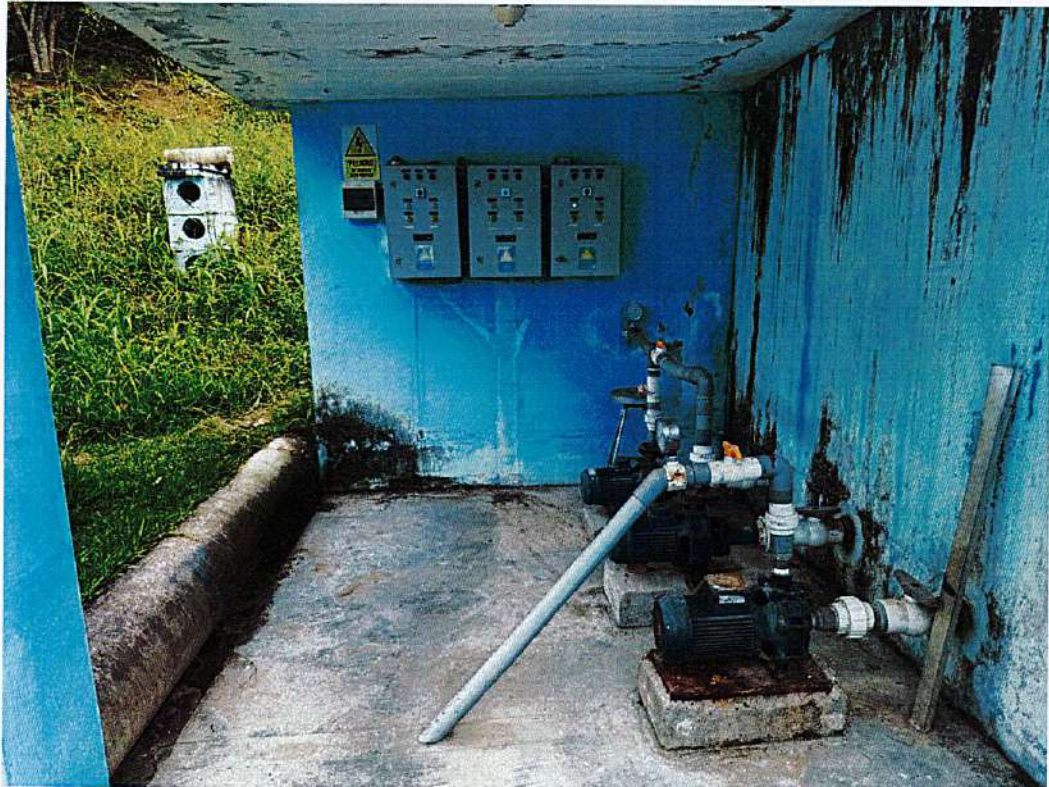
IMAGEN N°01: CASETA DE BOMBAS Y TABLEROS AFECTADOS

Indicamos, que los servicios de mantenimiento se encuentran dentro del programa anual de mantenimiento correctivo y preventivo del año 2025, para los equipos de la PTAP JAEN.