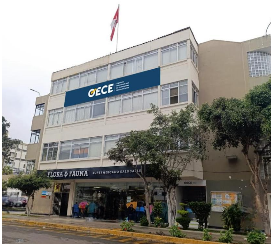
LETRERO ALTO SEDE CENTRAL