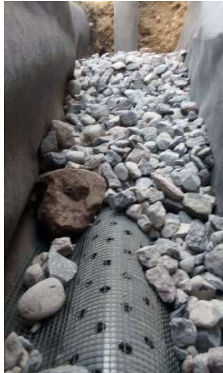
Imagen 4. Colocación de tubería envuelta en grava en servicio del 2022.

Realizar la instalación de la tubería cribada limpia y adecuadamente unida en la zanja de instalación, previa colocación de una cama de arena y cubierta en una malla que evite el ingreso de materiales finos. La instalación deberá ser realizada respetando las pendientes mínimas requeridas para la evacuación de las aguas captadas, además de asegurar una correcta conducción de estas desde los puntos de captación hasta los puntos de evacuación.