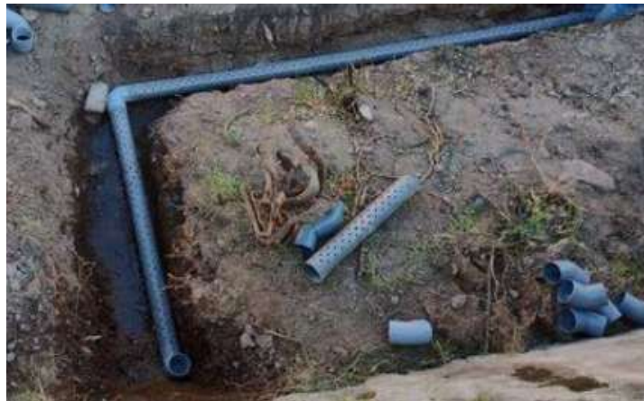
Imagen 2. Tubería instalada en el servicio del 2022.

La actividad consiste en retirar todo el material sedimentado dentro de la tubería de captación, mismo que permitirá recuperar su capacidad de conducir y eliminar el caudal empozado. Para el retiro de este material y la posterior limpieza de los orificios de captación existentes en esta tubería, el contratista deberá emplear todos los métodos físicos que considere necesarios, tales como limpieza por presión de agua, limpieza manual, utilización de herramientas manuales u otros. Adicionalmente, en caso alguno de los tramos de tubería cribada de captación se encuentre deteriorado por rotura, el contratista deberá considerar el cambio de este tramo de tubería, por una de las mismas características físicas, asegurando la adecuada unión de los tramos nuevos con los tramos existentes, además de corroborar que su disposición final en la zanja existente sea respetando las pendientes necesarias para la evacuación del agua captada. Finalmente, todos los residuos que se generen producto de la ejecución de estas actividades deberán ser adecuadamente retirados y eliminados de la zona de trabajo por el contratista.