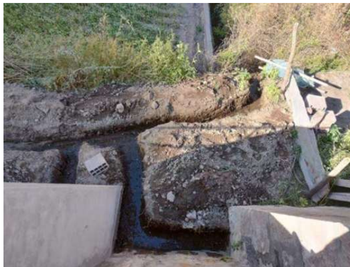
Imagen 1. Tramo intervenido en el 2022.

La actividad comprende el retiro de la tubería de captación de 4” que a consideración del área usuaria esta colmatada y con presencia de sedimentos y material fino en su interior, el mismo que no permite la captación y posterior eliminación del caudal de agua proveniente de las filtraciones existentes.