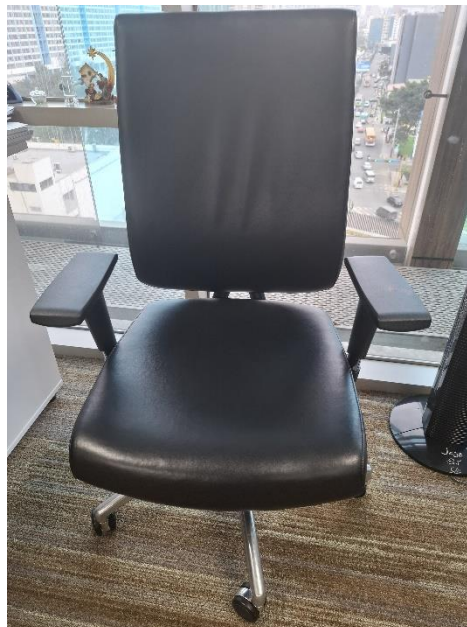
Foto de modelo de silla existente