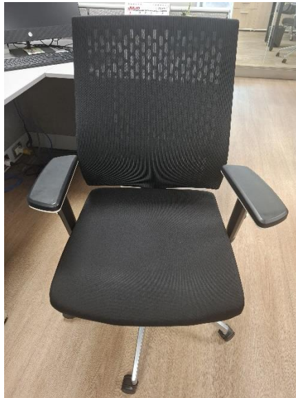
Foto de modelo de silla existente