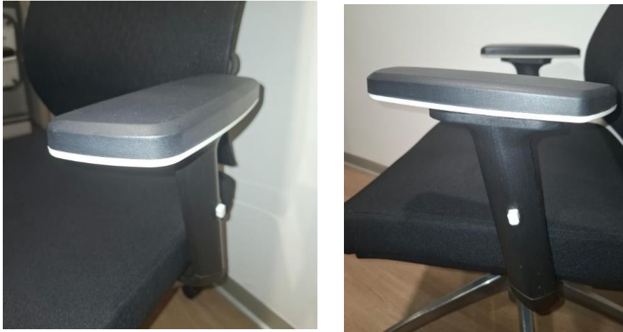
Foto de apoyabrazos de sillas existentes a reemplazar

“Decenio de la Igualdad de oportunidades para mujeres y hombres” “Año de la recuperación y consolidación de la economía peruana”