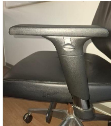
Foto de apoyabrazos de sillas existentes a reemplazar