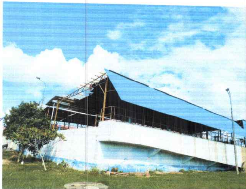
Imagen 3. Imagen Inferior; Parte del techado lateral y es visible parte afectada, techado del Decantador N°5

Parte lateral a implementar y construir techado, decantador 5 y filtro 9, tipo cola de pato