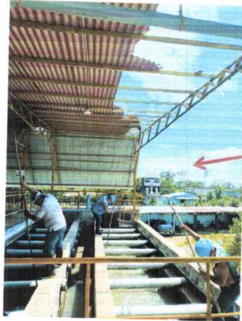
Imagen 2. Imagen lado derecho Zona Del Decantador N° 5, en proceso de lavado.

Parte lateral a implementar y construir techado, decantador 5 y filtro 9, tipo cola de pato