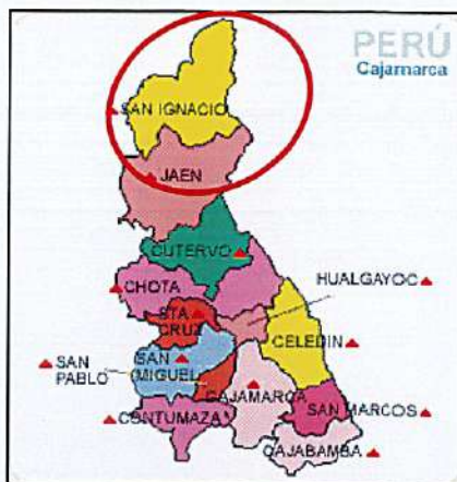
SAN IGNACIO: LOCALIZACIÓN GEOGRÁFICA DEL DISTRITO DE SAN IGNACIO