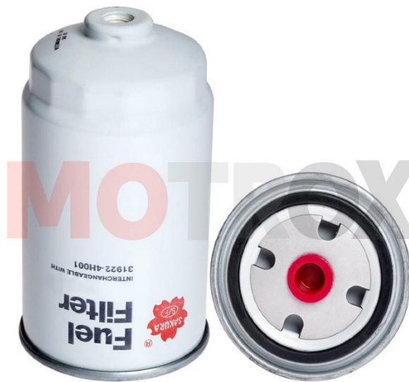
IMAGEN REFERENCIAL DEL FILTRO DE PETROLEO DE 30 MICRONES