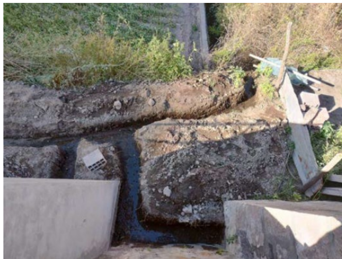
Imagen 1. Tramo intervenido en el 2022.

La actividad comprende el retiro de la tubería de captación de 4” que a consideración del área usuaria esta colmatada y con presencia de sedimentos y material fino en su interior, el mismo que no permite la captación y posterior eliminación del caudal de agua proveniente de las filtraciones existentes.