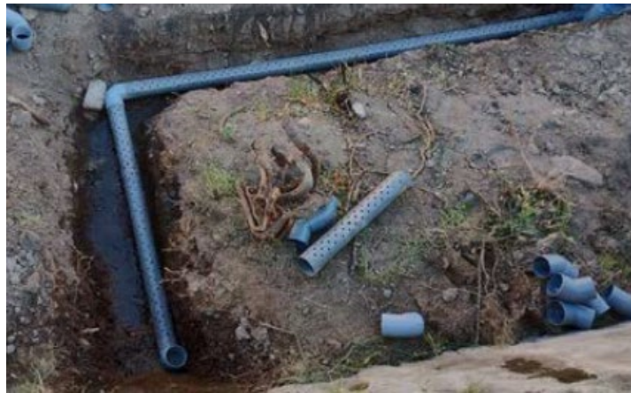
Imagen 2. Tubería instalada en el servicio del 2022.

La actividad consiste en retirar todo el material sedimentado dentro de la tubería de captación, mismo que permitirá recuperar su capacidad de conducir y eliminar el caudal empozado. Para el retiro de este material y la posterior limpieza de los orificios de captación existentes en esta tubería, el contratista deberá emplear todos los métodos físicos que considere necesarios, tales como limpieza por presión de agua, limpieza manual, utilización de herramientas manuales u otros. Adicionalmente, en caso alguno de los tramos de tubería cribada de captación se encuentre deteriorado por rotura, el contratista deberá considerar el cambio de este tramo de tubería, por una de las mismas características físicas, asegurando la adecuada unión de los tramos nuevos con los tramos existentes, además de corroborar que su disposición final en la zanja existente sea respetando las pendientes necesarias para la evacuación del agua captada. Finalmente, todos los residuos que se generen producto de la ejecución de estas actividades deberán ser adecuadamente retirados y eliminados de la zona de trabajo por el contratista.