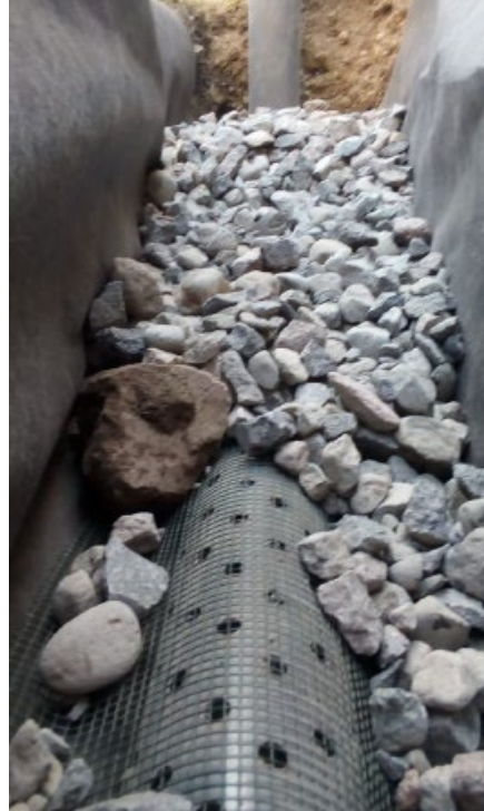
Imagen 4. Colocación de tubería envuelta en grava en servicio del 2022.

Realizar la instalación de la tubería cribada limpia y adecuadamente unida en la zanja de instalación, previa colocación de una cama de arena y cubierta en una malla que evite el ingreso de materiales finos. La instalación deberá ser realizada respetando las pendientes mínimas requeridas para la evacuación de las aguas captadas, además de asegurar una correcta conducción de estas desde los puntos de captación hasta los puntos de evacuación.