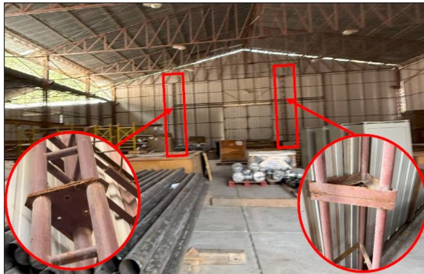
Imagen 5. Columnas con soldadura a reforzar.

Esta actividad consiste en realizar labores necesarias para reforzar la soldadura existente en las dos (02) columnas metálicas de dimensiones aproximada de 0.15 cm por lado, las cuales están identificadas en la imagen: