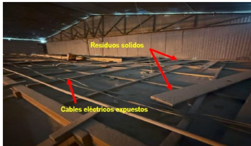
Imagen 3. Vista del techo del módulo prefabricado.

La partida comprende la limpieza integral de todos los residuos sólidos que estén ubicados en la parte superior del techo detallado. Dichos materiales serán evaluados por el contratista y el área usuaria, y en caso puedan ser reutilizados se entregarán a esta última; en caso no puedan ser reutilizados serán eliminados por el CONTRATISTA.