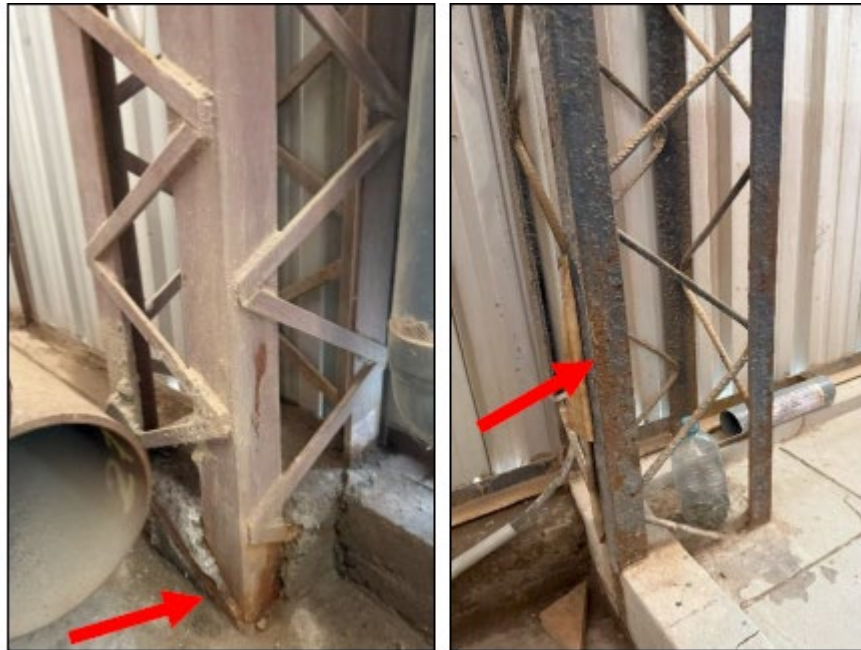
Imagen 4. Corrosión y presencia de salitre en base de concreto.

Consiste en limpiar la superficie de las diez (10) estructuras metálicas previamente identificadas, mediante la utilización de aditivos y escobillas de metal, con el fin de retirar toda la capa de óxido de las mismas hasta una altura de 3 metros aproximadamente y/o hasta donde se evidencie la presencia de oxido, conforme se puede evidenciar en la imagen N°04.