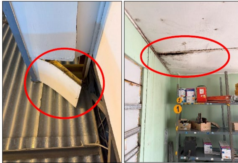
Imagen 2. Módulos afectados.