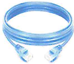
LINE CORD CAT 6 DE 1 MT