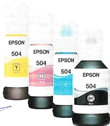
Botellas de Tinta Epson T504