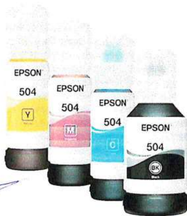
Botellas de Tinta Epson T504