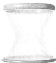
Fig.1: Retractor protector separador autoestático de incisión – rígido (no incluye diseño)