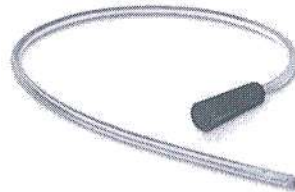
Fig.1: Sonda Nelaton (no incluye diseño)