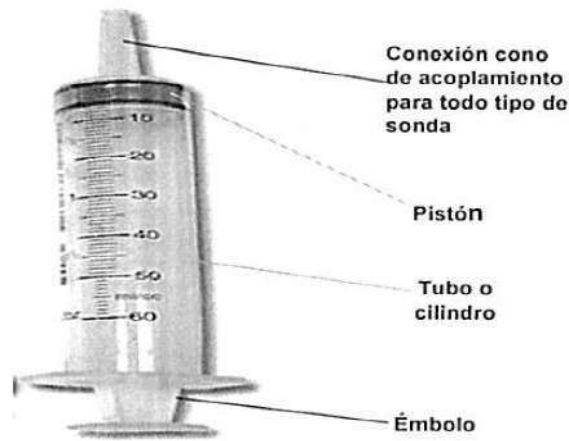
Fig. 1.: Jeringa descartable sin aguja (no incluye diseño)