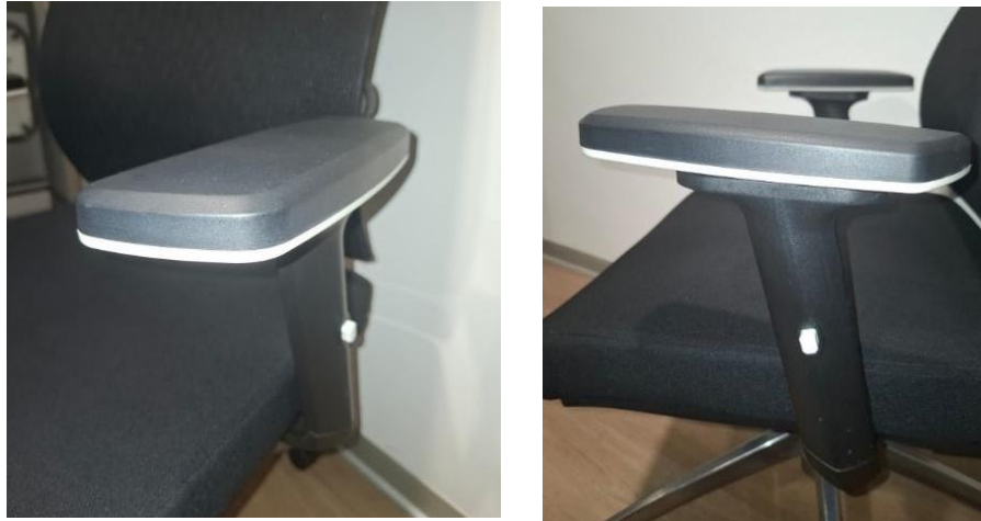
Foto de apoyabrazos de sillas existentes a reemplazar

“Decenio de la Igualdad de oportunidades para mujeres y hombres” “Año de la recuperación y consolidación de la economía peruana”