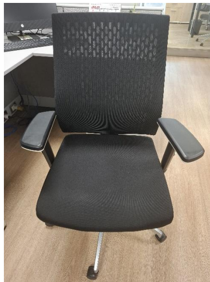
Foto de modelo de silla existente