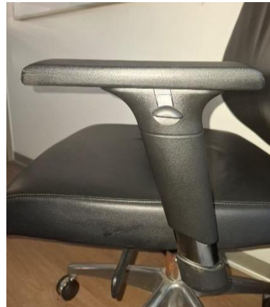
Foto de apoyabrazos de sillas existentes a reemplazar