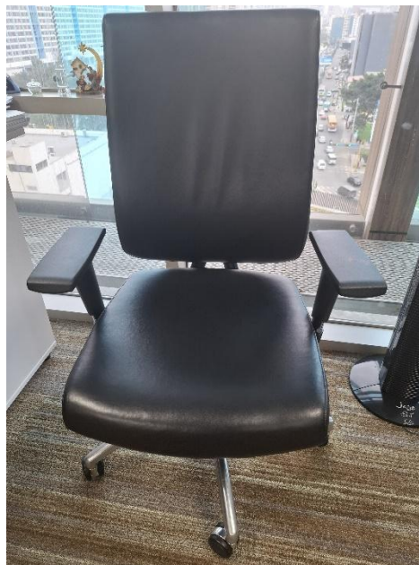
Foto de modelo de silla existente