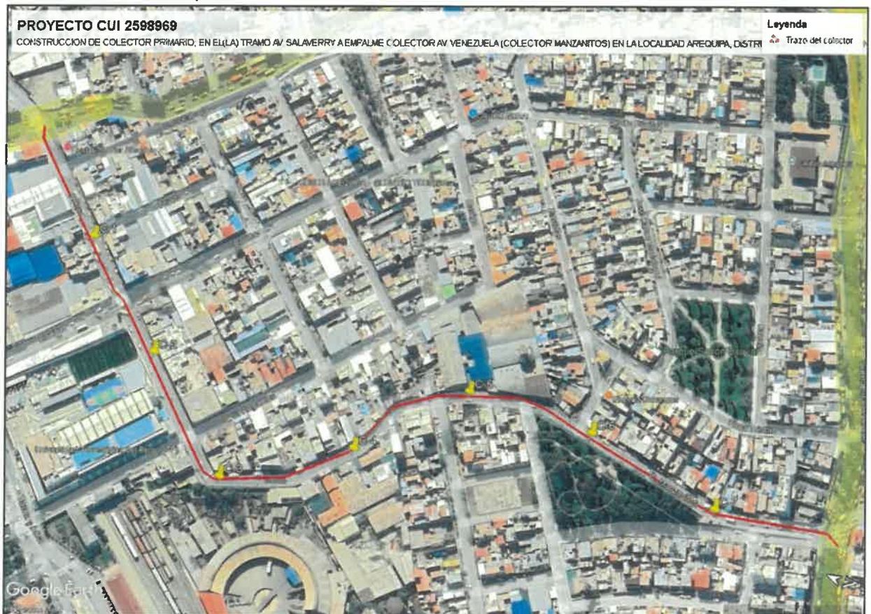
Ilustración 1: Ubicación preliminar de Calicatas (Fuente: SEDAPAR)