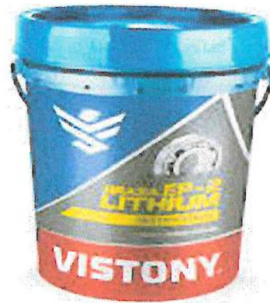
Imagen referencial de la grasa