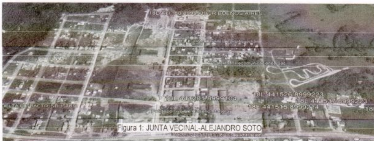
Figura 1: JUNTA VECINAL-ALEJANDRO SOTO