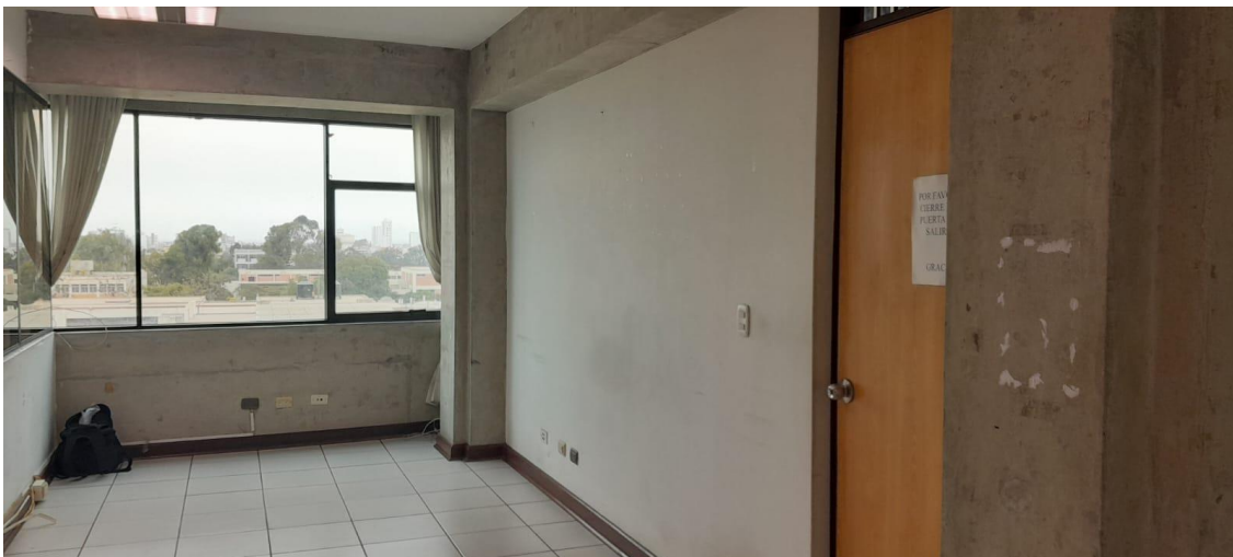
Ingreso a oficina