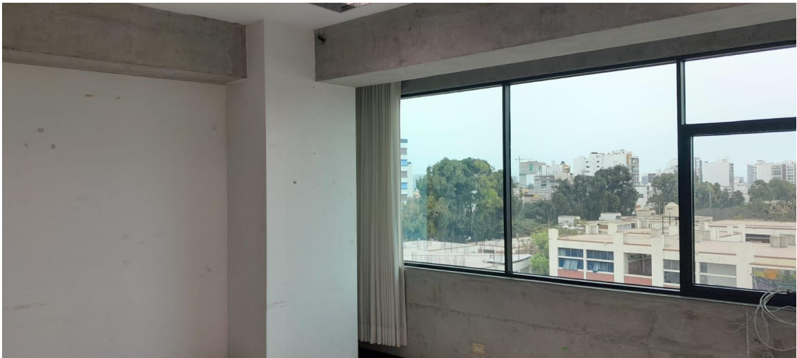
Vista con dirección a la Av. Jesus de Nazareth