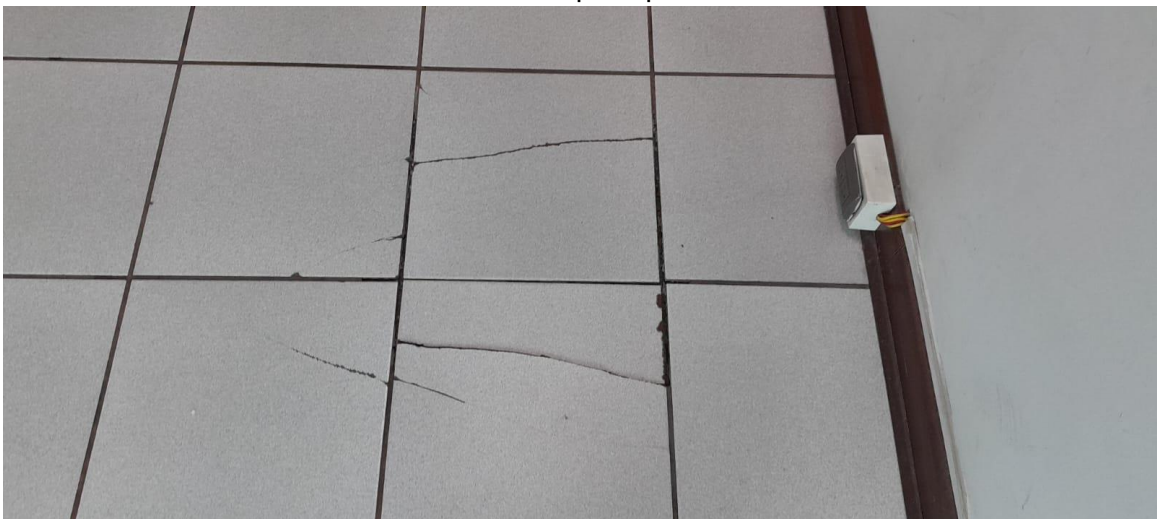
Cambio de cerámicos (10 und)