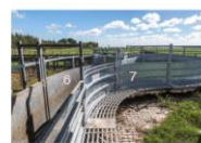
VISTA REFERENCIAL DE SECTOR 2,4,5,6,7