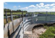
VISTA REFERENCIAL DE SECTOR 2,4,5,6,7