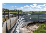
VISTA REFERENCIAL DE SECTOR 2.4.5.6.7