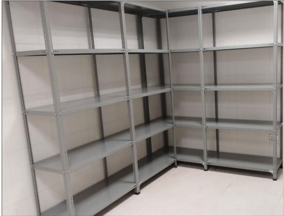
FOTO REFERENCIAL DE LA DISTRIBUCIÓN