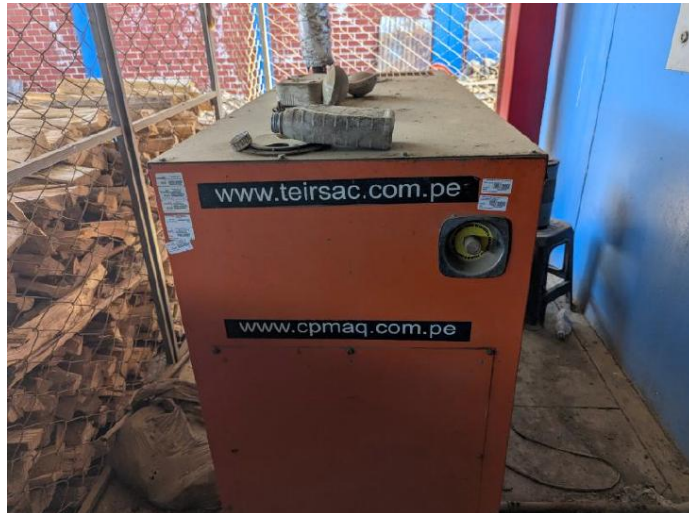
Vista General del grupo