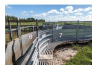
VISTA REFERENCIAL DE SECTOR 2,4,5,6,7