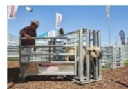
VISTA REFERENCIAL DE AREA DE VERIFICACION ZOOSANITARIA ZONA 10