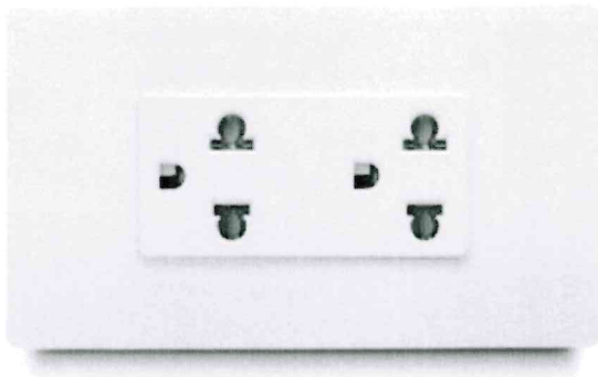
IMAGEN REFERENCIAL ITEM 3