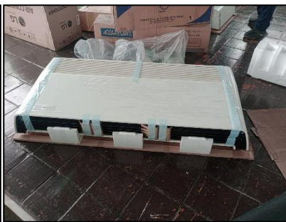
UNIDAD EVAPORADORA Y CONDENSADORA DE 48 KBTU/H, MARCA LG