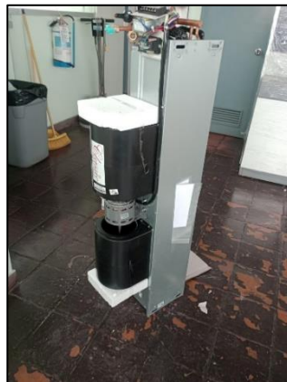
UNIDAD CONDENSADORA MARCA CIAC EVAPORADORA SIN CUBIERTA DE 36 KBTU/H, MODELO: EHXC-38