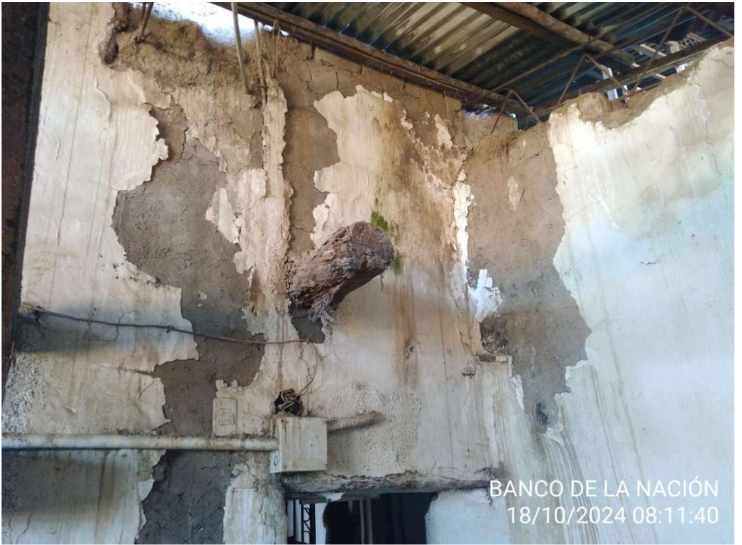
BANCO DE LA NACIÓN 18/10/2024 08:11:40