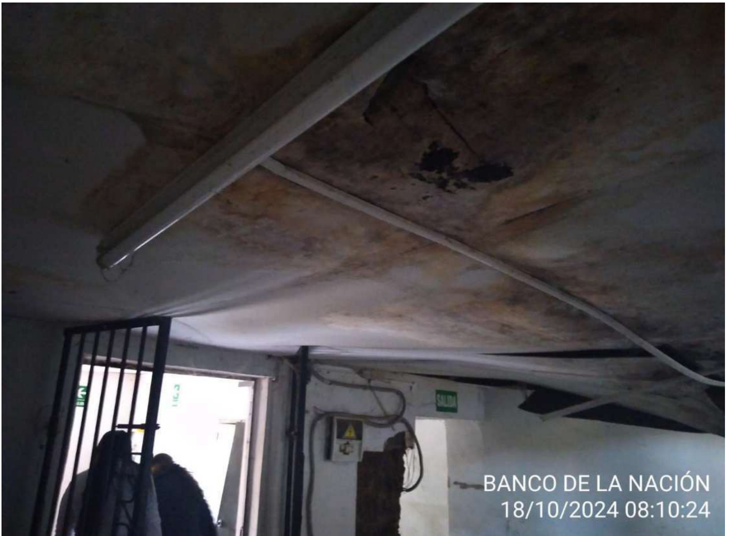
BANCO DE LA NACIÓN 18/10/2024 08:10:24