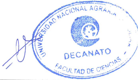
Firma del Solicitante