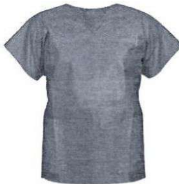
Fig.1: Chaqueta descartable (no incluye diseño)